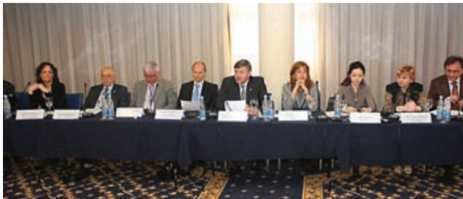
18-19 апреля 2011 года в Киеве был проведен «круглый стол» в рамках проекта ИКРИН

Чтобы обеспечить устойчивое развитие созданных центров и повысить квалификацию их сотрудников, проектом проводятся обучающие тренинги-семинары для пер-