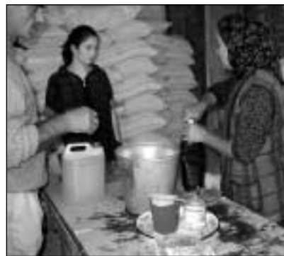
Исполнительные партнеры из НПО распределяют продовольственную помощь ВПП ООН

Хотелось бы, чтобы в перспективе работа продолжалась, и о нас не забывали наши доноры и гуманитарные организации, такие как ООН, УВКБ, ЮНИСЕФ и другие. Хотелось бы продолжать эту работу, так как проблемы здоровья остаются, люди нуждаются в бесплатных медикаментах, в гуманитарной и продуктовой помощи. Хотелось бы надеяться, что о наших проблемах будут знать и помнить.