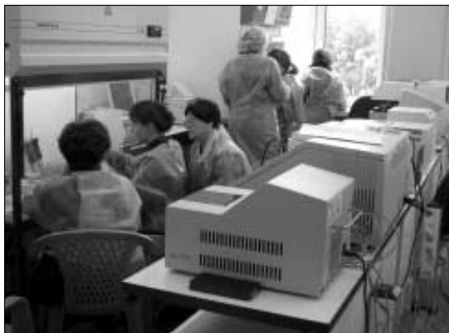
Участники первого европейского семинара по лабораторной диагностике ТОРС в Москве

В связи с изложенным очень важно иметь лабораторную сеть на местах, которая могла бы опреде-