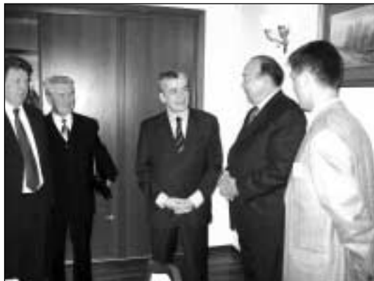
Президент Республики Башкортостан Муртаза Рахимов (второй справа) и Первый заместитель Министра здравоохранения Геннадий Онищенко (в центре) среди участников конференции в Уфе

18–19 сентября 2003 года в Иркутске в рамках Байкальского экономического форума прошел второй Всероссийский конгресс «Профессия и здоровье». Главной целью конгресса стало обсуждение проекта Программы «Здоровье работающего населения России на 2004–2015 годы». Проект подготовили специалисты ГУ НИИ медицины труда Российской академии медицинских наук (РАМН) – сотрудничающего центра ВОЗ по медицине труда в России, Министерства здравоохранения, Министерства труда и социального развития, Фонда социального страхования России.