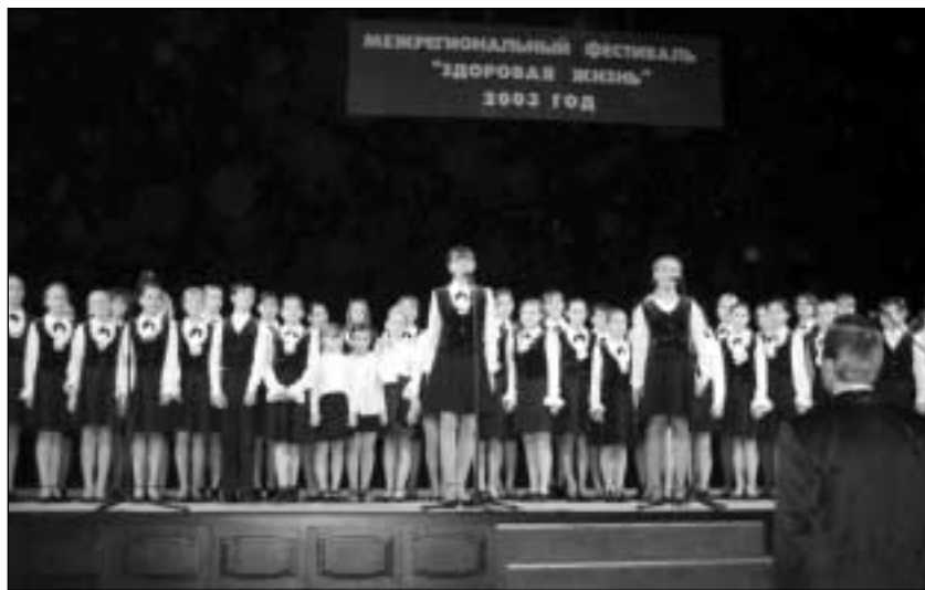
Выступает Вологодский молодежный хор

В духе межсекторального сотрудничества были заслушаны интересные выступления руководящих представителей в области образования, спорта, социальной сферы, программы ВОЗ «Здоровые