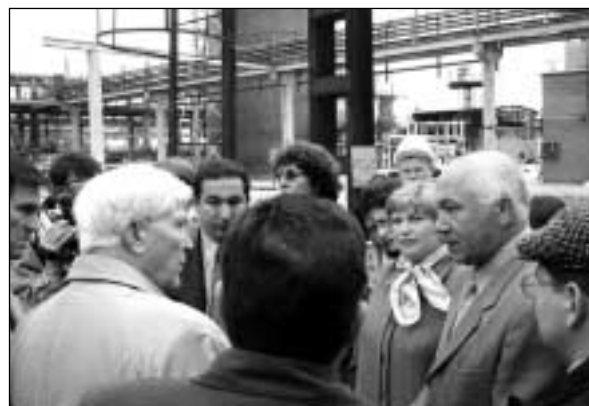
Участники конференции в Уфе посетили ОАО «Салаватнефтеоргсинтез»

Единодушно было признано, что расширение и углубление сотрудничества с ВОЗ представляется важным в решении комплексных вопросов охраны здоровья работающих. Например, Россия как можно скорее должна ликвидировать практику выплат рабочим «пособий за вредность», т.е. компенсаций за работу на вредном производстве, которая подрывает их здоровье. Вместо этого необходимо минимизировать риск и сделать работу безопасной. Именно так на Западе был существенно снижен уровень производственных несчастных случаев и профессиональных заболеваний. В российской действительности их в несколько раз больше, поэтому необходимы активные действия для решения этой проблемы.