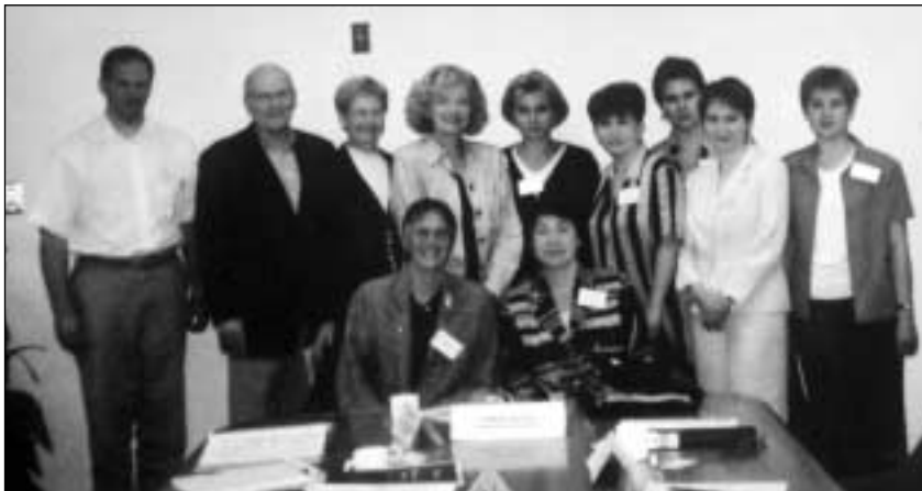
Заместители министров здравоохранения Британской Колумбии и Чувашии, участники ознакомительного тура и канадские хозяева на встрече в министерстве здравоохранения в Виктории, Британская Колумбия

В июле 2003 года представительная делегация руководящего состава российских организаторов здравоохранения посетила Западную Канаду в рамках программы ВОЗ/CIDA (Канадское агентство международного развития) по вопросам политики и управления здравоохранением в России. Пятеро участников представляли Чувашскую республику и один – Министерство здравоохранения Российской Федерации. Чувашская республика находится в процессе обширной реструктуризации здравоохранения. Она является одним из двух экспериментальных регионов России, участвующих в программе Всемирного Банка по предоставлению займа для проведения реформы здравоохранения в России. CIDA оказывает содействие Чувашии в реализации Стратегического плана по реструктуризации здравоохранения путем направления в Министерство здравоохранения Чувашии канадских экспертов. Кроме того, хозяева проявили инициативу, устроив для гостей поездку по стране, чтобы те основательнее узнали организацию и проблемы здравоохранения в Канаде.