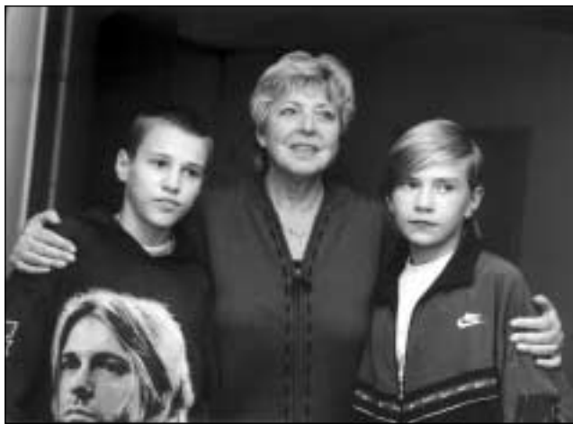
Мари-Луиз Марьян подружилась с русскими детьми

В октябре этого года Мари-Луиз Марьян в сопровождении председателя Национального Комитета ЮНИСЕФ Рейнхарда Шлагинтвейта посетила Санкт-Петербург. Национальный комитет ЮНИСЕФ в Германии давно и успешно сотрудничает с ЮНИСЕФ в Российской Федерации. Деньги собираются по всей Германии с помощью 8 000