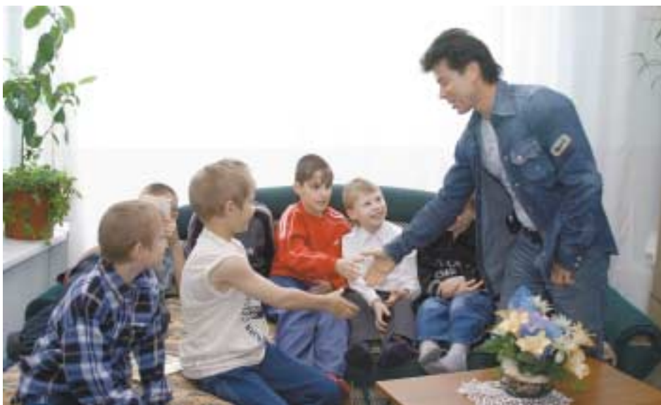
Олег Газманов встречается с детьми в московском Социально-реабилитационном центре «Отрадное»

- Что для Вас значит быть Послом Доброй Воли ЮНИСЕФ?