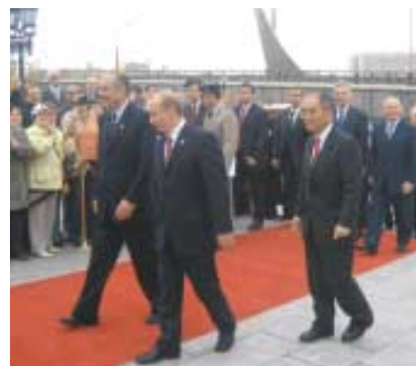
Слева направо: Президент Франции Жак Ширак, Президент России Владимир Путин и Генеральный директор ЮНЕСКО Коитиро Мацуура

Во время праздничных мероприятий Генеральный директор ЮНЕСКО встретился и имел беседы с главами некоторых государств и правительств. В том числе – с Президентом Франции Жаком Шираком, Президентом Китая Ху Цзиньтао, Президентом Израиля Моше Кацавом, Премьер-министром Португалии Хосе Сократесом, Премьер-министром Японии Дзюньитиро Коидзуми, а также с Послами доброй воли ЮНЕСКО Зурабом Церетели и Арой Абрамяном.