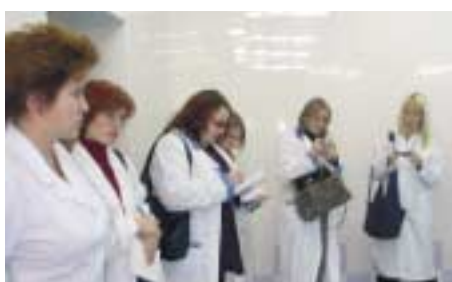
Журналисты посетили Президентский центр охраны здоровья матери и ребенка в городе Чебоксары

В первый день журналисты имели возможность посетить учреждения первичной медико-санитарной помощи в сельской и городской местности, где они ознакомились с работой врачей общей практики, а также некоторых учреждений социальной службы.