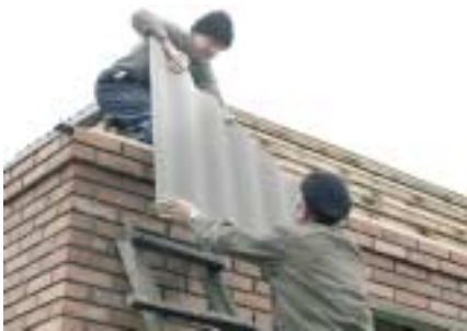
УВКБ ООН помогает внутренне перемещенным лицам из Чечни интегрироваться в Ингушетию

Гуманитарные потребности этого региона остаются высокими, результаты исследований показывают, что в 2005 году гуманитарная ситуация на Северном Кавказе не претерпела изменений ни в лучшую, ни в худшую сторону.