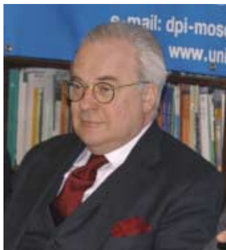
Посол Швеции Юхан Харальд Муландер

Сам Доклад представил профессор Российской Дипломатической академии Бахтияр Тузмухамедов, участвовавший в его написании. Рисуя общую картину, он отметил, что комплексные многоаспектные операции в пользу мира осуществляются сегодня, как правило, в сложной политической и гуманитарной обстановке, и поэтому требуют эффективного сотрудничества и тесного взаимного общения между всеми их