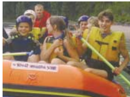
Сотрудники ООН помогают российской молодежи выбрать здоровый образ жизни

РФ предпринимает серьезные меры для решения этой проблемы, признавая распространение наркомании угрозой национальной безопасности. Успешно действует созданная в 2003 году служба Госнарконконтроля, усилия которой в прошлом году были сфокусированы на пресечении деятельности крупных организованных преступных групп, занимающихся поставками афганского героина в Россию и далее в Европу.