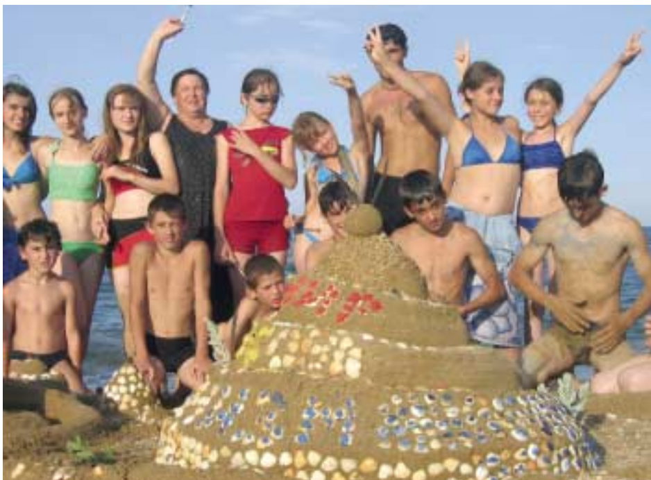
Все эти ребята подружались в летнем миротворческом лагере ЮНИСЕФ

Приятно посреди зимы думать о теплом лете. Мы представляем вашему вниманию рассказ, пронизанный теплом, об очень популярном летнем миротворческом лагере ЮНИСЕФ в Дагестане. Нынешним летом сюда со всего Северного Кавказа снова съедутся дети, чтобы жить в атмосфере мира, дружбы и толерантности, наслаждаясь солнцем.