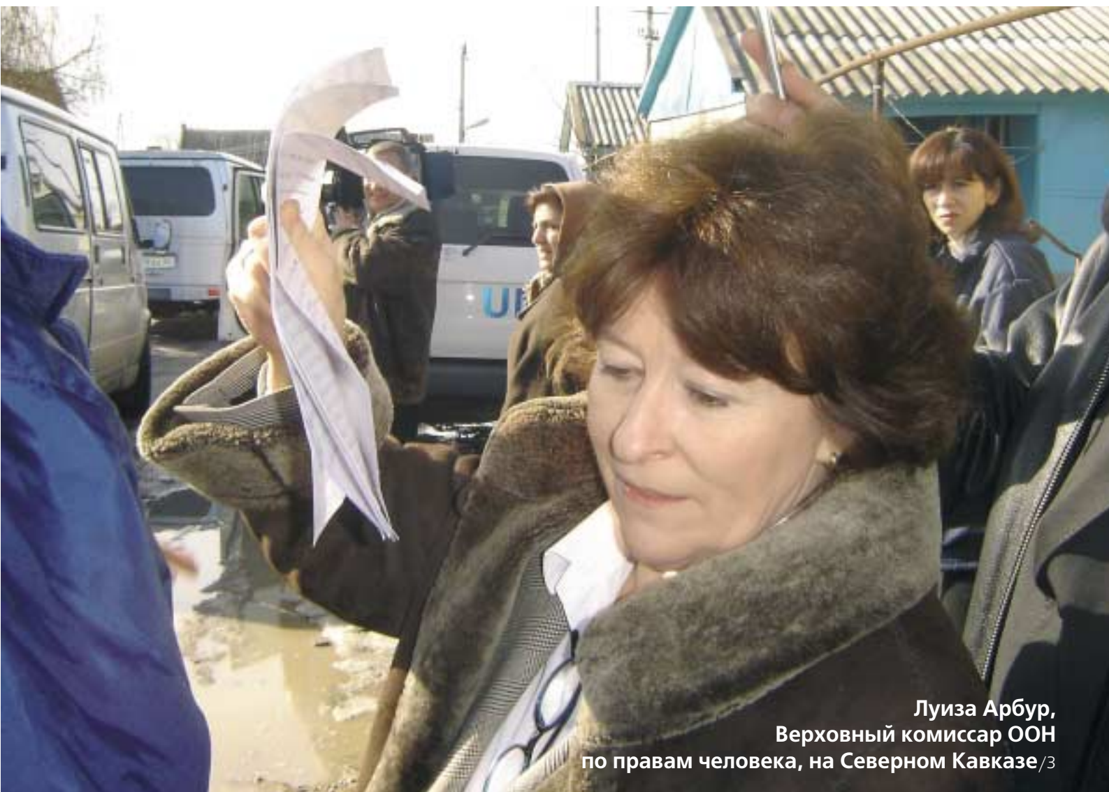
Луиза Арбур, Верховный комиссар ООН по правам человека, на Северном Кавказе /3

Издается Представительством Организации Объединенных Наций в Российской Федерации