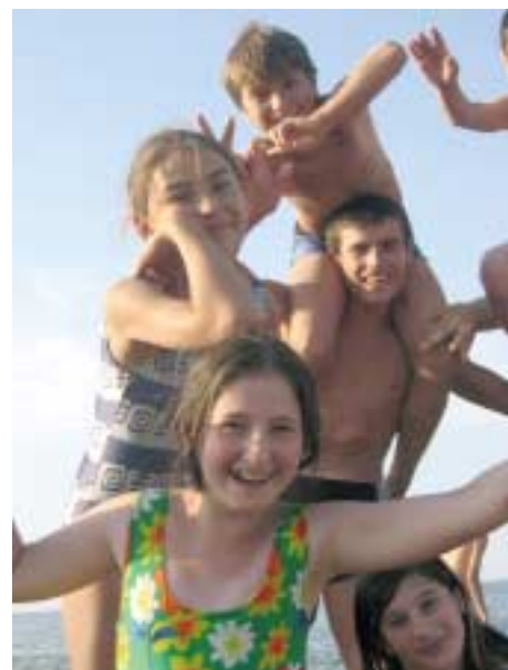
Есть время и для учебы, и для отдыха

Пока дети пытаются найти ответы на эти вопросы, им не хватает интеллектуальных средств, которые могли бы способствовать поиску правильных решений. Российским детям приходится иметь дело с системой образования, созданной еще при советской власти, отдающей предпочтение механическому запоминанию, а не критическому мышлению, а также с местными и национальными СМИ, где высказывание особых, отличных от других взглядов, не поощряется. Программа ЮНИСЕФ по миротворческому образованию и формированию толерантности пытается вооружить детей такими интеллектуальными средствами, которые помогли бы им думать критически и лучше справляться с теми взрывами чувств и предубеждениями, с которыми они сталкиваются в своей каждодневной жизни.