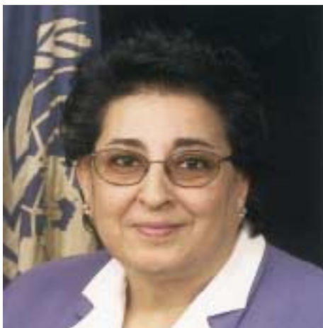
Исполнительный директор ЮНФПА Торайя Обейд

«Во время общения по телемосту у меня возникало чувство, что все мы, ребята из разных стран мира, – родственники, одна огромная семья. Потому что занимаемся одним делом, стараемся что-то изменить, нам не безразличны проблемы окружающего нас общества. И мы – одно целое, где бы ни