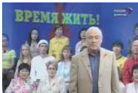
Телемарафон «Время жить!» по проблеме СПИДа при участии Владимира Познера

Парадокс в том, что в РФ, несмотря на огромные ресурсы, около 30 миллионов человек все еще живут за чертой бедности, при этом половину бедного населения составляют работающие. Вследствие высокого уровня смертности, особенно среди мужчин, население страны сокращается. Хотя россияне - одни из самых образованных в мире, нерешенной остается проблема равного доступа к образованию, и есть опасность, что она будет усугубляться. Ухудшаются стартовые возможности для детей из бедных регионов, сельских районов и неблагополучных семей. Еще одна проблема - ВИЧ/СПИД. По официальным данным, в России 300 тыс. инфицированных, но, по другим оценкам, эта цифра составляет около миллиона человек.