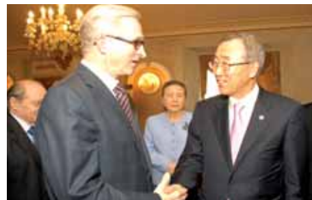
Знакомство с президентом Российского союза промышленников и предпринимателей Александром Шохиним

Сегодня в России насчитывается 24 компании – члена договора. Среди них такие признанные лидеры, как ОК РУСАЛ, ОАО «Российские железные дороги», ХК «Интеррос», ГК «Ренова», ОАО «Трансаэро», а также Российский союз промышленников и предпринимателей (РСПП). На конференции, прошедшей при участии руководителей компаний, Министерства иностранных дел РФ, представи-