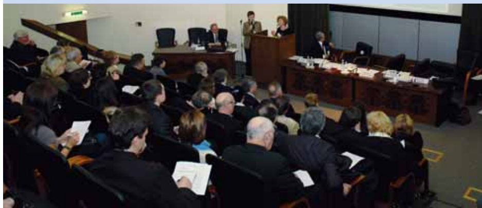
Конференция «Влияние климатических изменений на окружающую среду и здоровье человека»

Н едостаток питьевой воды в ближайшее время будет остро ощущаться в Центральной и Южной Европе, а также странах Центральной Азии. Сокращение объёмов водных запасов до 80% в засушливый летний период приведёт к дефициту пресной воды и повысит риск распространения инфекций. Под угрозой окажется качество воды и состояние водопроводно-канализационных систем. На сегодняшний день даже в странах, не испытывающих недостатка в питьевой воде, этот важный ресурс не отвечает микробиологическим и химическим стандартам ВОЗ.