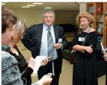
Беседа Марка Дансона с журналистами

- Российская Федерация - самое крупное государство из 53 стран региона, где работает Европейское бюро ВОЗ. Вы знаете, я получил приглашения принять участие в мероприятиях, приуроченных к Всемирному дню здоровья, от многих мировых центров здравоохранения, но свой выбор, тем не менее, решил остановить на России. Хотите знать почему?