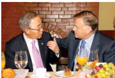
Беседа с президентом ОАО «Российские железные дороги» Владимиром Якуниным

В ходе своего первого официального визита в Россию Генеральный секретарь ООН Пан Ги Мун встретился с лидерами российского бизнеса, присоединившимися к российской сети Глобального договора (ГД) ООН. Главная ее цель - обеспечить последовательное соблюдение компаниями, подписавшими Договор, десяти принципов ГД в области прав человека, трудовых отношений, охраны окружающей среды и борьбы с коррупцией. Сеть также создаст возможности для вовлечения в этот процесс новых членов из России.