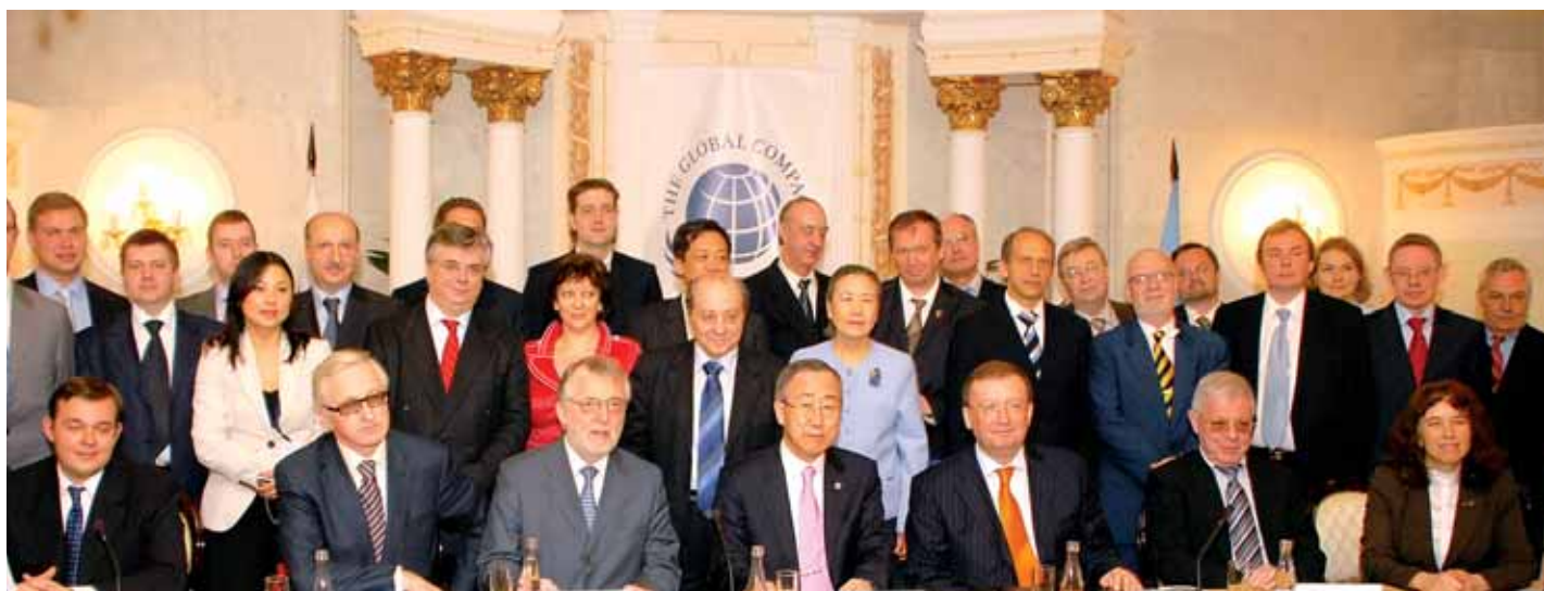
Встреча Генерального секретаря ООН Пан Ги Муна с участниками Глобального договора в России 10 апреля 2008 года

«Сегодня, запуская сеть Глобального договора, российские компании присоединяются к тысячам других компаний из 120 стран мира. Глобальный договор - это вызов для лидеров бизнеса всего мира, которые должны соблюдать в своей деятельности 10 принципов договора», - сказал Генеральный секретарь. Он подчеркнул, что приверженность этим принципам способствует повышению производительности труда, уровня корпоративного управления и в целом совершенствованию работы участников национального и мирового рынка. «Сегодня появился новый глобальный потребитель, - отметил г-н Пан Ги Мун, - который требует от бизнеса предоставления информации о со-