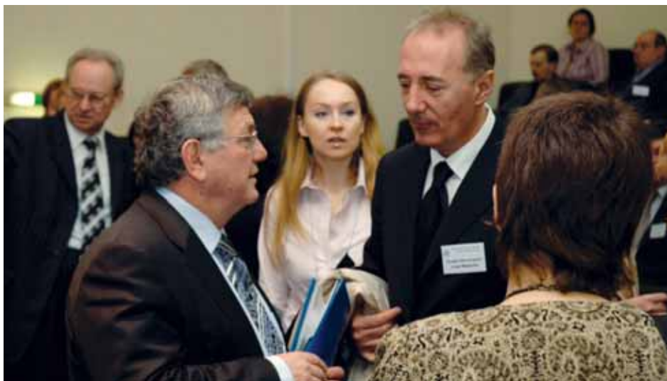
Оживленный диалог участников конференции в Совете Федерации России

здравоохранения (ВОЗ) в нынешнем году поставила эти вопросы «во главу угла», сделав их основной темой Всемирного дня здоровья-2008. Основной идеей этой инициативы было призвать страны во всём мире укрепить функциональный потенциал национальных систем здравоохранения с тем, чтобы они смогли играть принципиально новую, более важную и активную роль в защите здоровья населения от изменений климата.