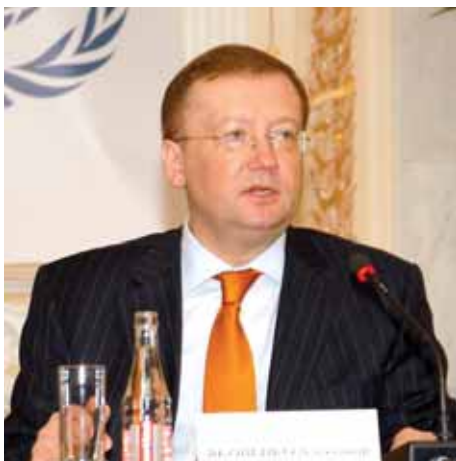
Приветствие заместителя министра иностранных дел РФ Александра Яковенко

Говоря о значимости Глобального договора для бизнеса, заместитель Министра иностранных дел РФ Александр Яковенко назвал публичное признание десяти принципов договора подтверждением «ежедневной честной игры» компаний в любой сфере их деятельности. Он отметил, что понимание своей социальной ответственности начало приходить к российским предпринимателям сравните-