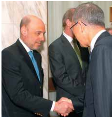
Автор статьи (слева) обменивается рукопожатием с Пан Ги Муном

Эти самые игроки (major economies) собрались на отдельное заседание вместе с «восьмеркой» в рамках самми-