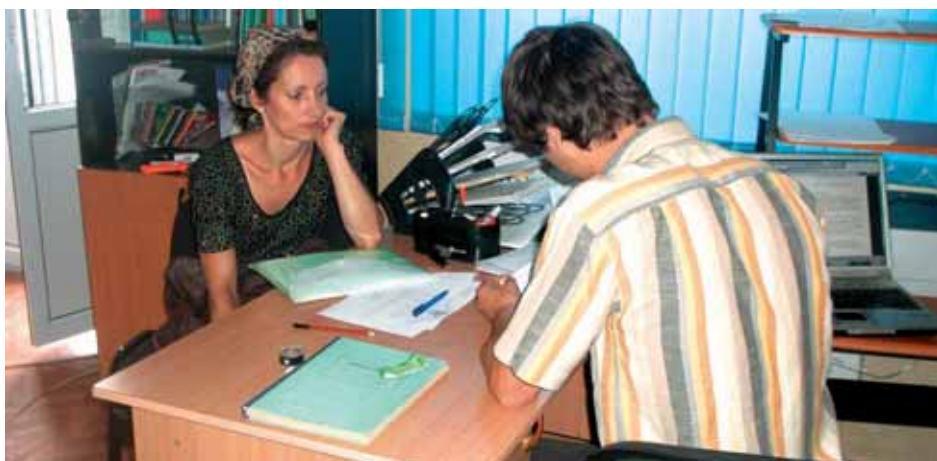
В Консультационном центре фонда «Низам», Чеченская Республика