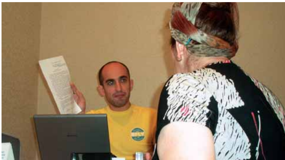
Консультацию жительнице Чечни дает юрист фонда «Низам» – одного из партнеров УВКБ ООН

– На Северном Кавказе УВКБ ООН совместно с другими агентствами оказывает содействие лицам, перемещенным внутри страны (ВПЛ), и беженцам путем предоставления юридических консультаций и строительства жилья. УВКБ ООН стремится распространять идеи толерантности в отношении бе-