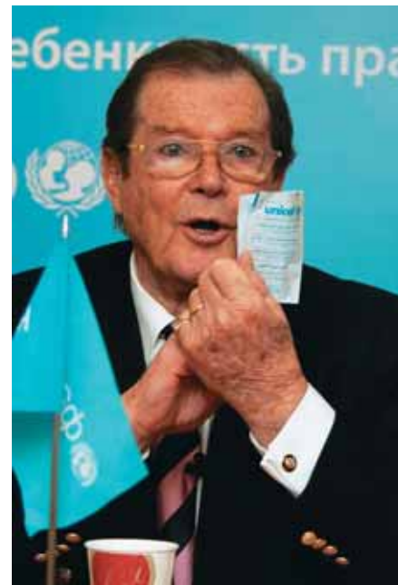
В офисе ЮНИСЕФ в Москве Роджер Мур демонстрирует пакетик соли для регидрации организма. Этот пакетик может спасти 1 детскую жизнь

«Статистика – довольно скучная свещь, когда речь идет только о цифрах, – сказал далее Мур, – Но меня потрясло, когда я узнал, что в мире ежедневно умирает 40 тысяч детей,