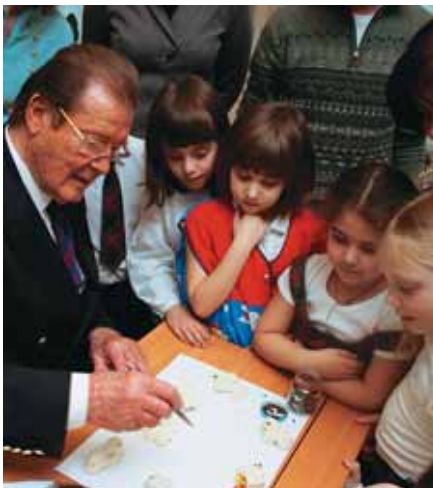
На уроке прикладного искусства в московской школе № 1447

Во время визита актер и его супруга посетили одну из московских школ, работающих в системе инклюзивного образования. В школе более 500 учеников, 27 из которых имеют инвалидность. Ребята очень ждали приезда гостей и подготовили несколько сюрпризов. «Я научился многим полезным вещам, – поделился сэр Роджер Мур своими впечатлениями от визита, – например, рисовать матре-