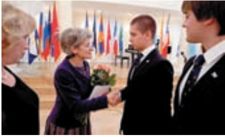
Ирина Бокова: «Это – школа нового гуманизма»

говорила о «Поддержке культурного разнообразия в глобализованном мире». В заседании приняли участие Президент России Дмитрий Медведев и Президент Турции Абдулла Гюль. Генеральный директор ЮНЕСКО особо подчеркнула важность Всеобщей декларации ЮНЕСКО о культурном разнообразии в условиях постоянно меняющегося мира. «Культурное разнообразие стало реальностью современного общества, – отметила Ирина Бокова. – Таковым же оно должно стать и для политики, развивающейся в условиях демократии и плюрализма».