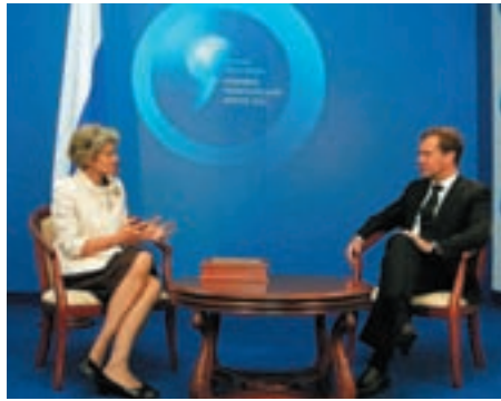
Генеральный директор ЮНЕСКО Ирина Бокова и Президент Российской Федерации Дмитрий Медведев обсудили работу ЮНЕСКО в России

На первой сессии Форума, проходившей 7 сентября, Генеральный директор ЮНЕСКО выступила с докладом на тему «Культурное разнообразие на пути к прочному миру». Г-жа Бокова призвала мировое сообщество