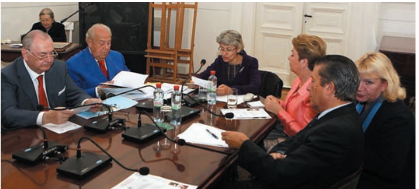
Ирина Бокова приняла участие в Международной научной конференции Российской академии художеств на тему «Гуманистические основы и социальные функции искусства»

Выступая на следующий день на пленарном заседании Ярославского Форума, Ирина Бокова