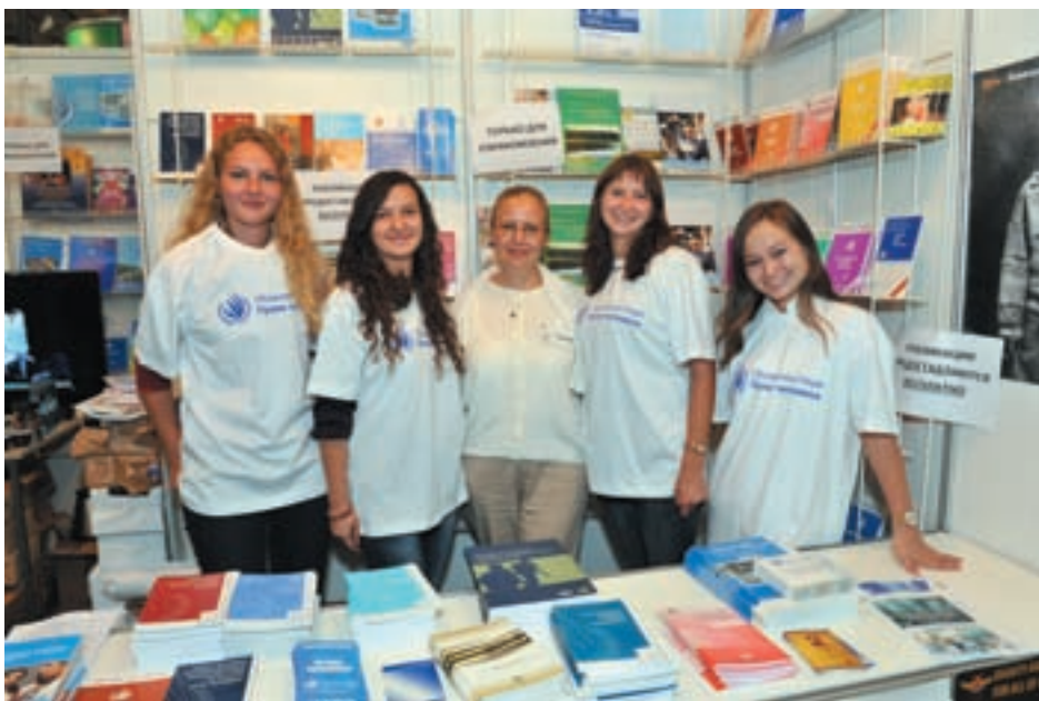
Волонтеры Управления Верховного комиссара ООН по правам человека на Московской международной книжной выставке-ярмарке

В рамках первого направления много публикаций представили правозащитный центр «Мемориал», фонд «Общественный вердикт», общественная правозащитная организация «Гражданский контроль», региональная благотворительная правозащитная организация «Комитет за гражданские права». Темы касались прав заключенных, уголовного судопроизводства, а также нарушений прав человека со стороны правоохранительных органов. Эти вопросы вызвали большой интерес у посетителей; некоторые из них получили профессиональную консультацию представителей соответствующих организаций. Правозащитная организация «Солдатские матери Санкт-Петербурга» представила литературу о правах призывников и военнослужащих; спрос на нее подтвердил актуальность этой темы в российском обществе. Проблема дискриминации была широко освещена в публикациях Информационно-аналитического центра «Сова», автономной некоммерческой организации «Юрикс», а также антидискриминационного центра «Мемориал». Этой тематике сопутствовали такие вопросы, как свобода совести, проблема экстремизма и фашизма, свобода мирных собраний. Люди, интересующиеся проблемой защиты прав коренных народов, могли получить всю необходимую информацию в