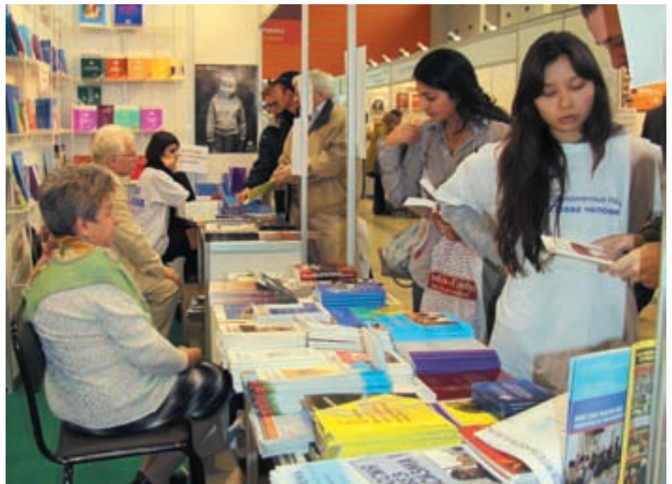
Представители правозащитных организаций и волонтеры УВКПЧ консультируют посетителей выставки

В общей сложности, на стенде «Права человека» в течение 5 дней пуб-