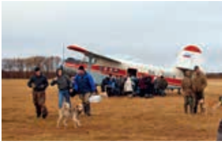
Офис ВОЗ в Российской Федерации

местных больниц и медицинских пунктов в труднодоступных и отдаленных поселках и деревнях округа.