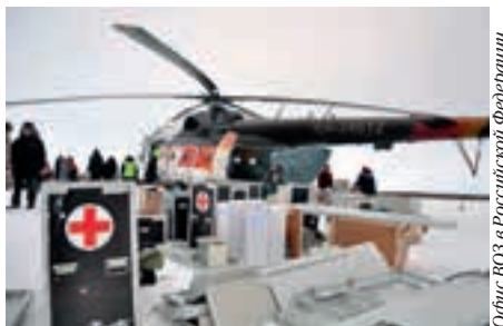
Офис ВОЗ в Российской Федерации

Проект «Воздействие изменений климата на здоровье