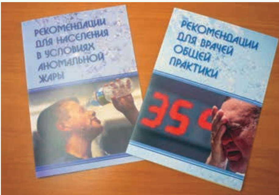
Офис ВОЗ в Российской Федерации

Одним из основных результатов проекта стало предложение по разработке и внедрению автоматической компьютерной системы сбора данных для раннего выявления превышения типичных уровней заболеваемости, обращаемости и смертности в Архангельской области. Апробация данной системы планируется на 2014 год. Помимо местных практических результатов, внедрение системы позволит использовать ее в качестве пилотного проекта как в других регионах России, так и на национальном уровне.