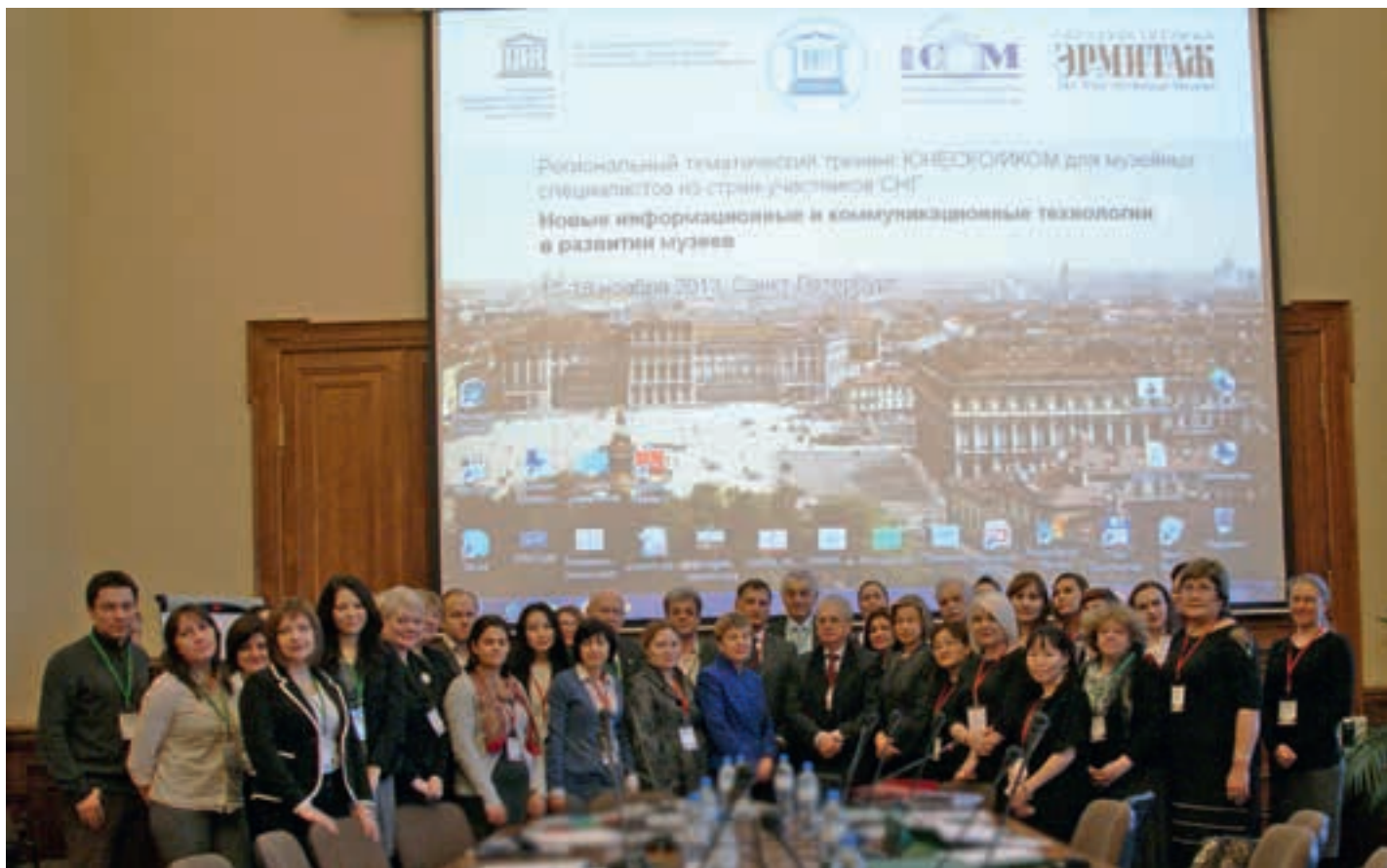
Участники тренинга «Новые информационные и коммуникационные технологии в развитии музеев»

деятельностью рассматриваются применительно к реалиям и проблемам современности. Особое внимание уделяется сохранению и актуализации наследия, а также использованию в данных целях информационных технологий и возникающим в этой связи новым проблемам.