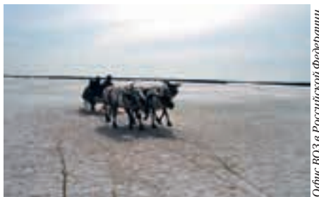
Офис ВОЗ в Российской Федерации

Адаптация систем здравоохранения в Российской Федерации