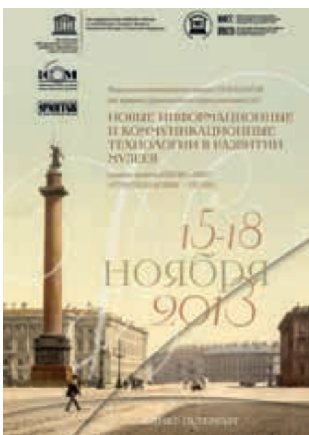
Программа тренинга «Новые информационные и коммуникационные технологии в развитии музеев»

Музеи являются неотъемлемой частью программ ЮНЕСКО с момента создания Организации, как центры для сохранения, изучения и популяризации культурного наследия. Бюро ЮНЕСКО в Москве реализует различные мероприятия и проекты, направленные на укрепление потенциала и развитие партнерства между музеями стран СНГ, в том числе посредством проведения тренингов ЮНЕСКО/ИКОМ. (Наша справка: ИКОМ – Международный совет музеев – неправительственная профессиональная международная организация, созданная в 1946 году. ИКОМ имеет в ЮНЕСКО и при Экономическом и социальном совете ООН высший консультативный статус категории «А».